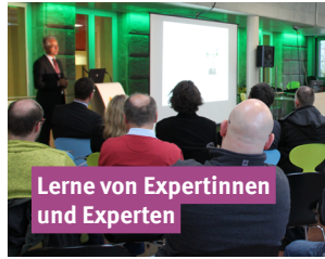
Lerne von Expertinnen und Experten

In Gastvorträgen, Workshops und Diskussionsrunden wie dem EMI-Forum holst du dir das Expertenwissen aus erster Hand. Eine gute Gelegenheit, Kontakte für dein Studium und die spätere Karriere zu knüpfen.