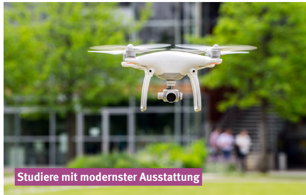
Studiere mit modernster Ausstattung

Die Qualität deiner Ausbildung hängt auch von der Ausstattung ab, in der du studierst: Bei uns erwarten dich Labore auf der Höhe der Zeit mit modernem, fachspezifischem Equipment.