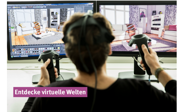
Entdecke virtuelle Welten

Computer Vision, Virtual- und Augmented Reality sowie Informationsvisualisierung sind Kernthemen. Neuartige Bediensysteme und 3D-Kameras kannst du bei uns ausprobieren.