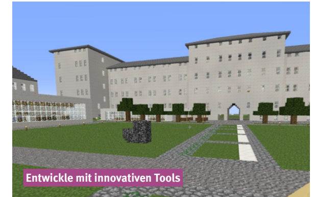
Entwickle mit innovativen Tools

Arbeite mit agilen Projektmanagement-Methoden wie Scrum und erstelle virtuelle Projekte. Lerne, wie moderne Großprojekte geplant werden.