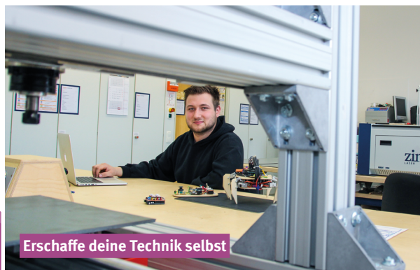
Erschaffe deine Technik selbst

Geht nicht, gibts nicht! In den bestens eingerichteten Hochschulwerkstätten kannst du benötigte Bauteile selbst produzieren. Vom Laser bis zum 3D-Druck: Deiner Kreativität sind an der OTH Amberg-Weiden keine Grenzen gesetzt.