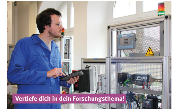
Vertiefe dich in dein Forschungsthema!

Du willst promovieren? Mit deinem Masterabschluss legst du dafür die Grundlagen. Du lernst wissenschaftlich zu arbeiten sowie mündlich und schriftlich zu präsentieren. In Veröffentlichungen und auf Konferenzen stellst du deine Ergebnisse einem breiten Publikum vor.