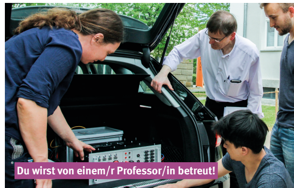
Du wirst von einem/r Professor/in betreut!

Hol' dir das Zukunftswissen – an der OTH Amberg-Weiden kannst du dich in innovativen Forschungsprojekten engagieren. Für dein persönliches Masterstudium wählst du zusammen mit deinem/r Betreuer/in ein aktuelles Forschungsthema. Hier wurden z. B. schon Themen aus den Bereichen IT-Security, Künstliche Intelligenz, Autonomes Fahren oder der technischen Thermodynamik behandelt – Was könnte dein Thema sein? Setze dich vorab mit den ProfessorInnen in Verbindung, diskutierte deine Möglichkeiten und wähle dein Forschungsthema!